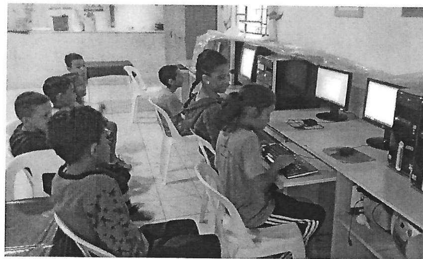
Aula de Informática. Data: 21/01/2019.