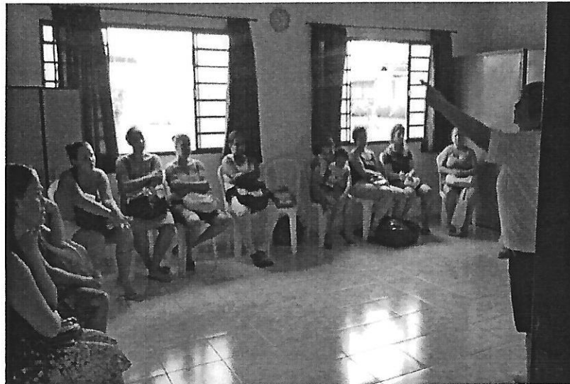
Planejamento das atividades. Data: 22/01/2019.

FILIADO A OSCAL E USE - UTILIDADE PÚBLICA FEDERAL, ESTADUAL E MUNICIPAL FUNDADO EM 25/06/1960 RUA ALVARES CABRAL, 381 - CEP 12505-070 - CAMPO DO GALVÃO - GUARATINGUETÁ - SP FONE 3132 7959 CNPJ 48.548.184/0001-55 e-mail gf@irmaoaltino.com.br