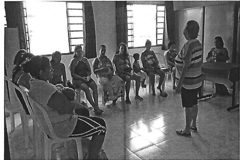
Planejamento das atividades. Data: 24/01/2019.