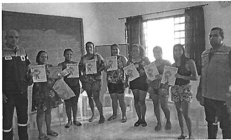
Roda de conversa com a Defesa Civil. Data: 17/12/2018.

FILIADO A OSCAL E USE - UTILIDADE PÚBLICA FEDERAL, ESTADUAL E MUNICIPAL FUNDADO EM 25/06/1960 RUA ALVARES CABRAL, 381 - CEP 12505-070 - CAMPO DO GALVÃO - GUARATINGUETÁ - SP FONE 3132 7959 CNPJ 48.548.184/0001-55 e-mail gf@irmaoaltino.com.br