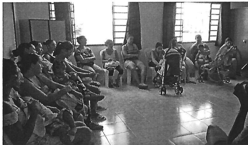
Roda de conversa. Data: 31/01/2019.