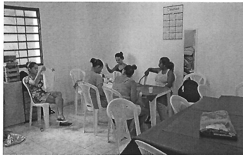
Aula de bordado. Data: 22/01/2019.