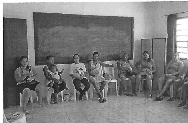
Recepção das usuárias. Data: 10/01/2019.