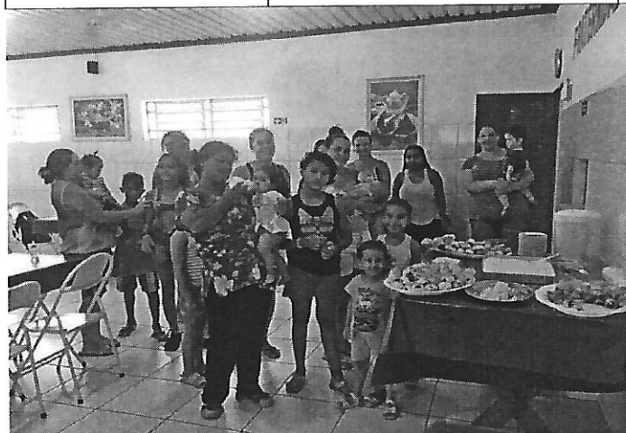
Recepção das usuárias. Data: 08/01/2019.

No dia 31/01/2019, mediante a solicitação das usuárias, foi realizada uma roda de conversa sobre o tema relacionamentos abusivos. O objetivo consistiu em refletir sobre os relacionamentos estabelecidos, os papéis socialmente determinados para homens e mulheres e os mecanismos de combate à violência doméstica (avanços e fragilidades da legislação vigente).