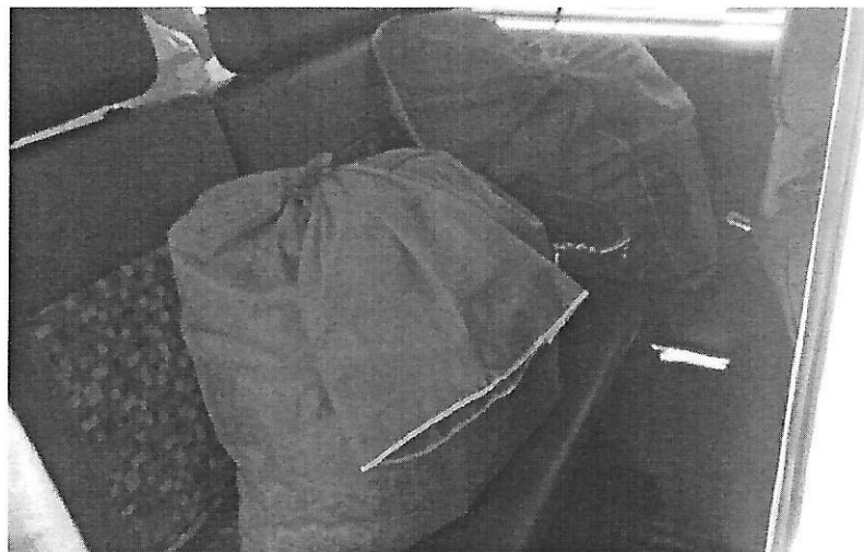
Enxovais de bebê doados. Data: 28/01/2019.