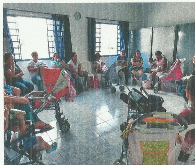
Debate sobre família. Data: 24/09/2019.