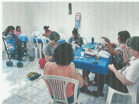
Oficina de fuxico. Data: 10/09/2019.