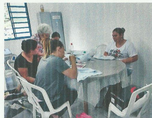
Oficina de bordado. Data: 24/09/2019.