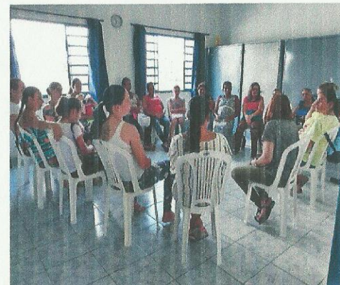
Debate sobre família. Data: 12/09/2019.