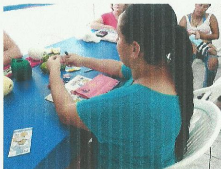
Oficina de bordado. Data: 17/09/2019.