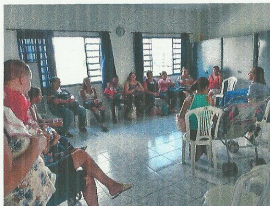
Parceria com Secretaria da Saúde. Data: 10/09/2019.