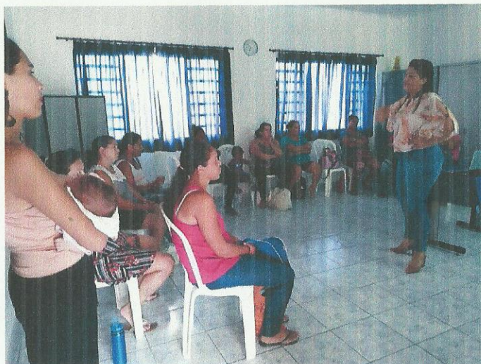
Parceria com Centro de Saúde. Data: 17/09/2019.