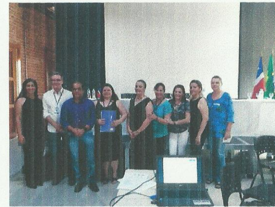
Conferência Municipal de Assistência Social. Data: 19/09/2019.