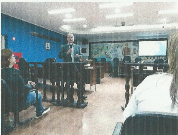
Semana da Saúde. Data: 26/09/2019.