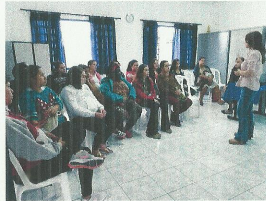
Parceria com CREAS. Data: 05/09/2019.