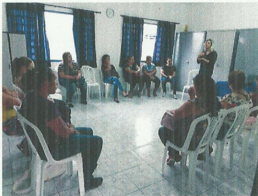
Parceria com CRAS. Data: 03/09/2019.