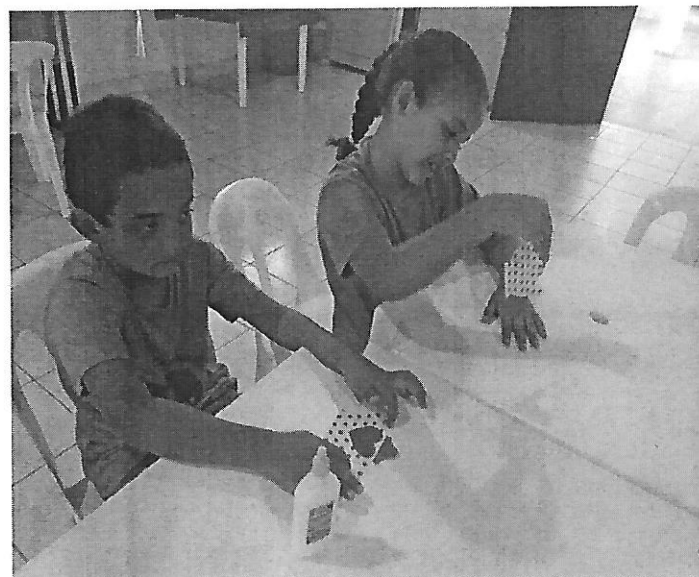
Oficina de artesanato. Data: 10/01/2019.