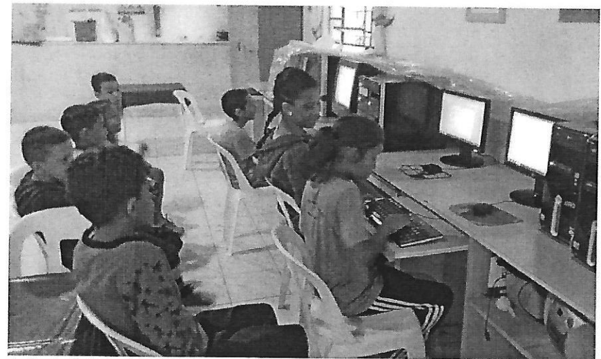
Aula de Informática. Data: 21/01/2019.