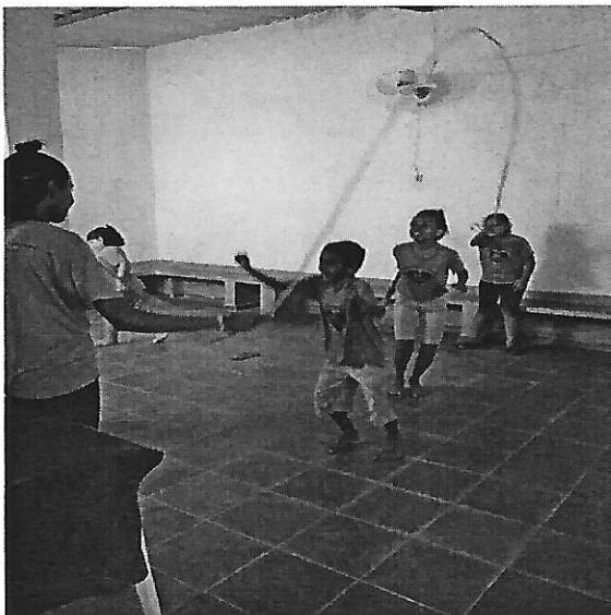
Jogos e brincadeiras. Data: 21/01/2019.