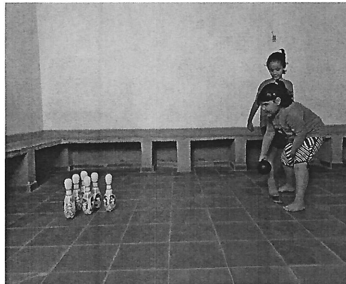
Jogos e brincadeiras. Data: 25/01/2019.