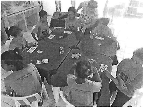
Bingo. Data: 15/01/2019.

FILIADO A OSCAL E USE - UTILIDADE PÚBLICA FEDERAL, ESTADUAL E MUNICIPAL FUNDADO EM 25/06/1960 RUA ALVARES CABRAL, 381 - CEP 12505-070 - CAMPO DO GALVÃO - GUARATINGUETÁ - SP FONE 3132 7959 CNPJ 48.548.184/0001-55 e-mail gf@irmaoaltino.com.br