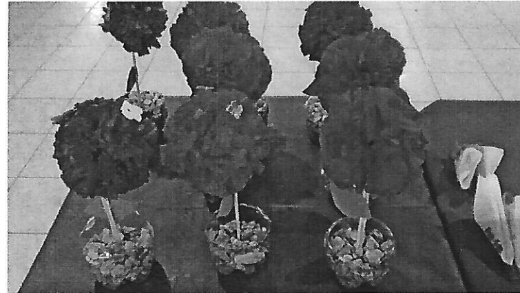
Oficina de artesanato. Data: 17/01/2019.