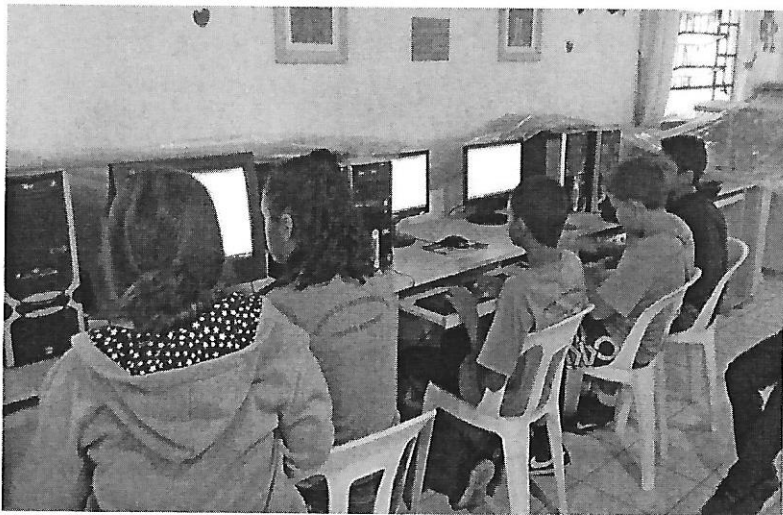
Aula de Informática. Data: 07/01/2019.

FILIADO A OSCAL E USE - UTILIDADE PÚBLICA FEDERAL, ESTADUAL E MUNICIPAL FUNDADO EM 25/06/1960 RUA ALVARES CABRAL, 381 - CEP 12505-070 - CAMPO DO GALVÃO - GUARATINGUETÁ - SP FONE 3132 7959 CNPJ 48.548.184/0001-55 e-mail gf@irmaoaltino.com.br