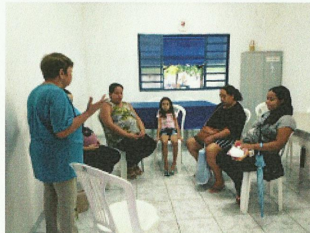
Apresentação do Plano BEM e boas vindas. Data: 09/01/2020.