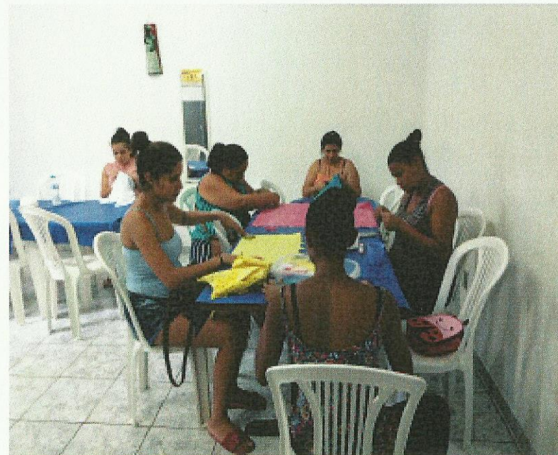
Oficina de fuxico. Data: 23/01/2020.