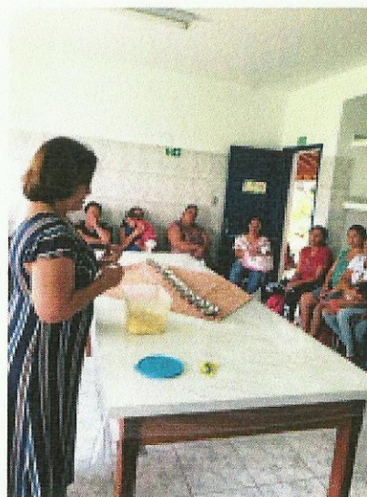
Aula de culinária. Data: 14/01/2019.