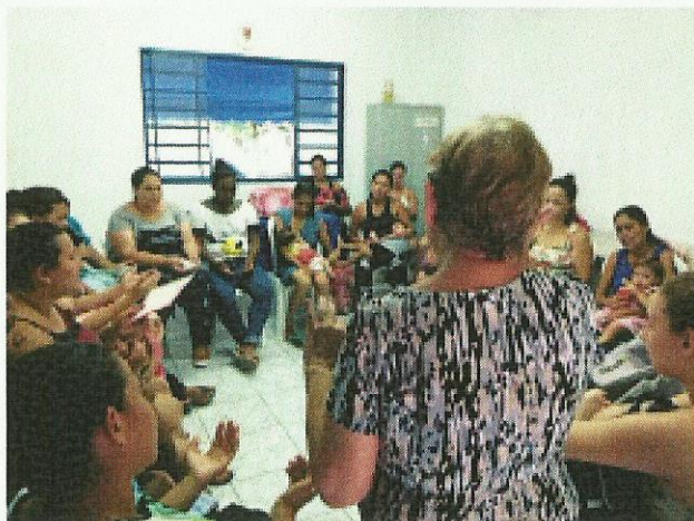
Apresentação do Plano BEM e boas vindas. Data: 07/01/2020.

FILIADO A OSCAL E USE - UTILIDADE PÚBLICA FEDERAL, ESTADUAL E MUNICIPAL FUNDADO EM 25/06/1960 RUA ALVARES CABRAL, 381 - CEP 12505-070 - CAMPO DO GALVÃO - GUARATINGUETÁ - SP FONE 3132 7959CNPJ 48.548.184/0001-55 e-mail gf@irmaoaltino.com.br