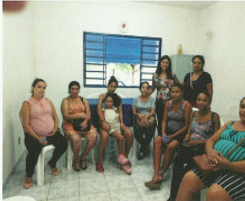
“Os territórios da Assistência Social”. Data: 30/01/2020.

FILIADO A OSCAL E USE - UTILIDADE PÚBLICA FEDERAL, ESTADUAL E MUNICIPAL FUNDADO EM 25/06/1960 RUA ALVARES CABRAL, 381 - CEP 12505-070 - CAMPO DO GALVÃO - GUARATINGUETÁ - SP FONE 3132 7959CNPJ 48.548.184/0001-55 e-mail gf@irmaoaltino.com.br