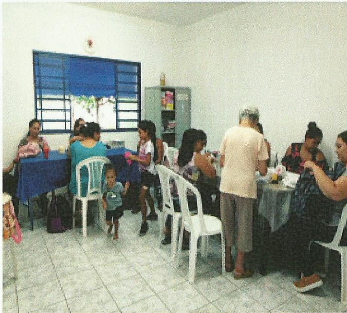
Oficina de ponto cruz. Data: 14/01/2020.

FONE 3132 7959CNPJ 48.548.184/0001-55 e-mail gf@irmaoaltino.com.br