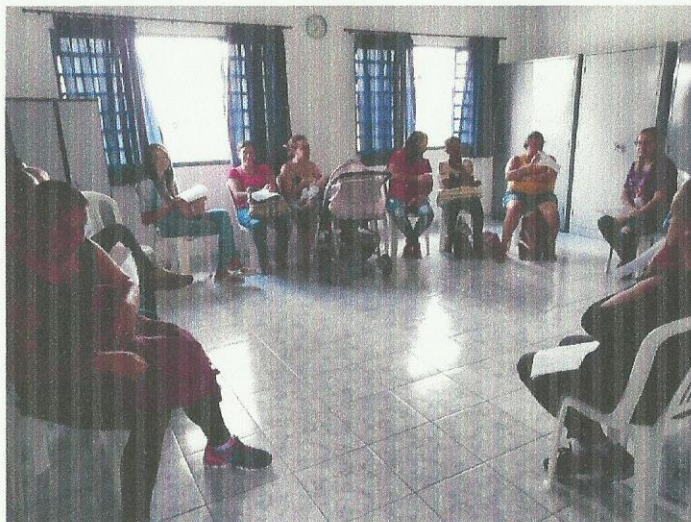
Saúde da Mulher (Secretaria da Saúde). Data: 03/03/2020.

FILIADO A OSCAL E USE - UTILIDADE PÚBLICA FEDERAL, ESTADUAL E MUNICIPAL FUNDADO EM 25/06/1960 RUA ALVARES CABRAL, 381 - CEP 12505-070 - CAMPO DO GALVÃO - GUARATINGUETÁ - SP FONE 3132 7959CNPJ 48.548.184/0001-55 e-mail gf@irmaoaltino.com.br