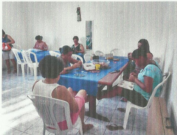
Oficina de fuxico. Data: 12/03/2020.