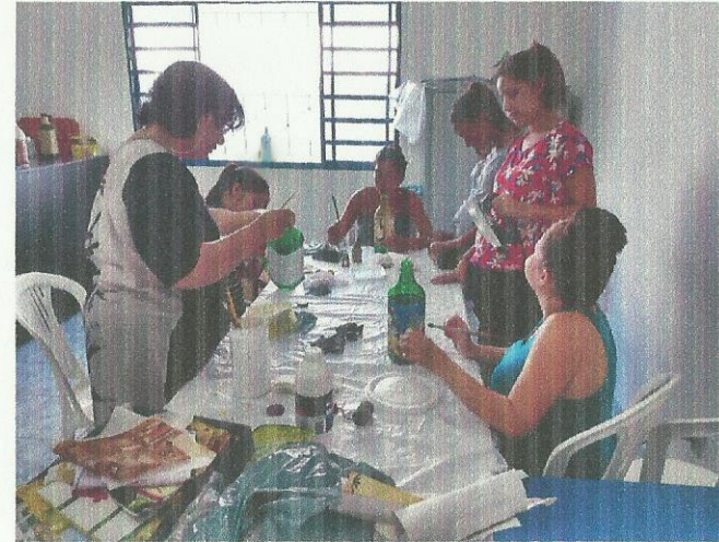
Oficina de pintura. Data: 12/03/2020.