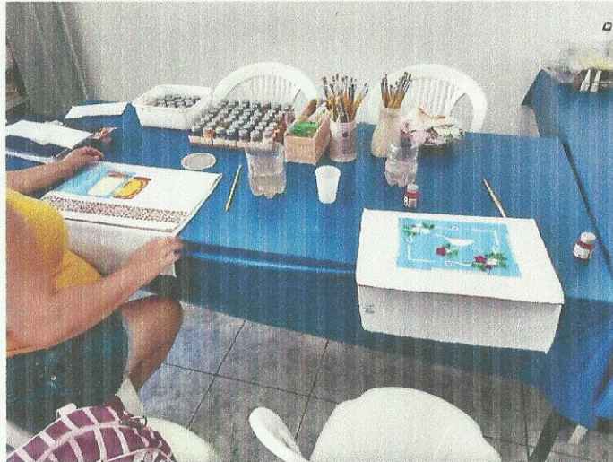
Oficina de pintura. Data: 03/03/2020.

FILIADO A OSCAL E USE - UTILIDADE PÚBLICA FEDERAL, ESTADUAL E MUNICIPAL FUNDADO EM 25/06/1960 RUA ALVARES CABRAL, 381 - CEP 12505-070 - CAMPO DO GALVÃO - GUARATINGUETÁ - SP FONE 3132 7959CNPJ 48.548.184/0001-55 e-mail gf@irmaoaltino.com.br