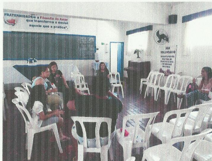
Informações sobre Covid-19. Data: 17/03/2020.