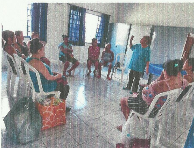
Dia Internacional da Mulher. Data: 12/03/2020.