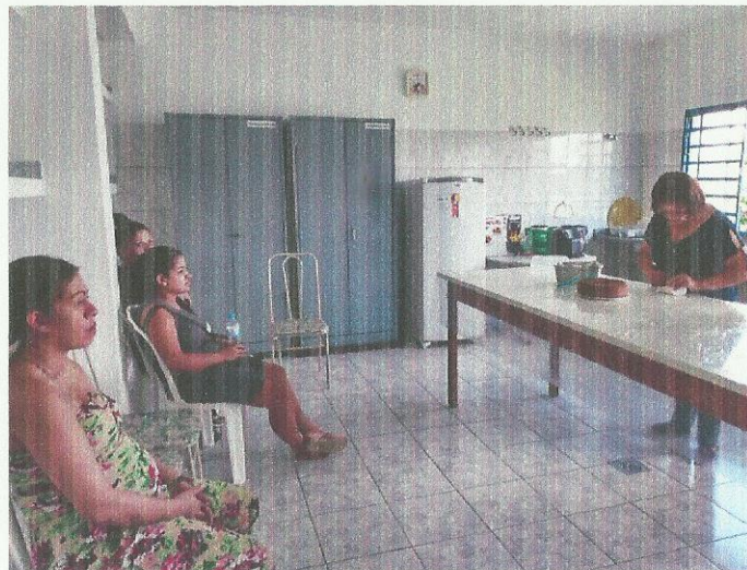
Aula de culinária. Data: 05/03/2020