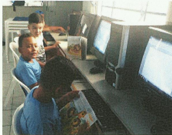
Aula de Informática. Data: 21/01/2020.