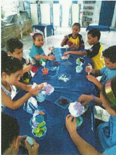
Projeto Criatividade. Data: 13/01/2020.

www.irmaoaltino.com.br - E-mail: gf@irmaoaltino.com.br