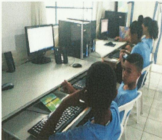
Aula de Informática. Data: 07/01/2020.