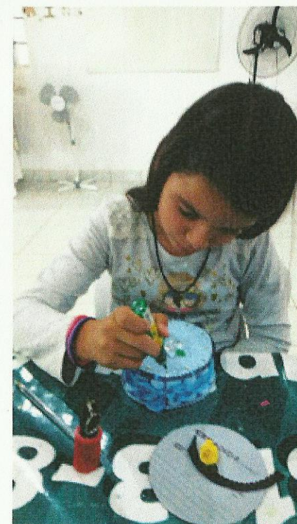
Aula de Artesanato: 09/01/2020.