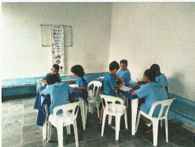
Metas para 2020. Data: 06/01/2020.

Dias: 29 e 31- Atividade: Coordenação motora. Estratégia: estimular os alunos a desenvolverem com maior precisão as atividades de coordenação motora. Impacto social: os alunos tiveram uma boa aceitação da atividade desenvolvendo bem toda a atividade.