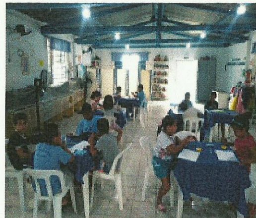
Estímulo à coordenação. Data: 29/01/2020.