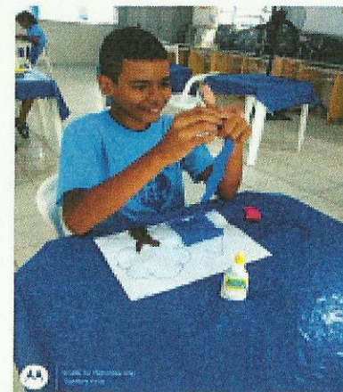
Estímulo à coordenação. Data: 31/01/2020.