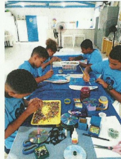
Aula de Artesanato. Data: 23/01/2020.