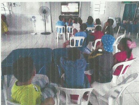
Exibição de filme. Data: 13/03/2020.