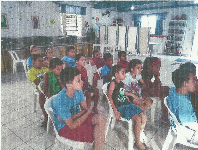
Exibição de filme. Data: 18/03/2020.

www.irmaoaltino.com.br - E-mail: gf@irmaoaltino.com.br