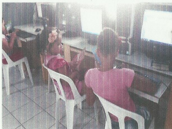
Aula de Informática. 03/03/2020.