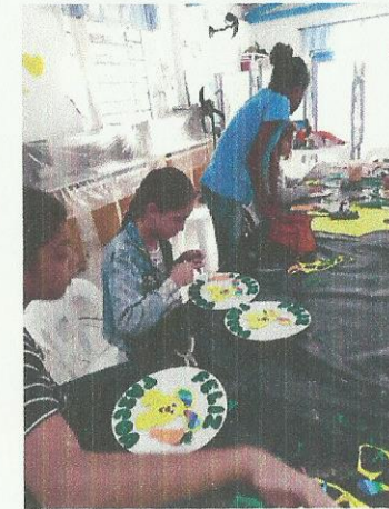
Aula de Artesanato. Data: 12/03/2020.