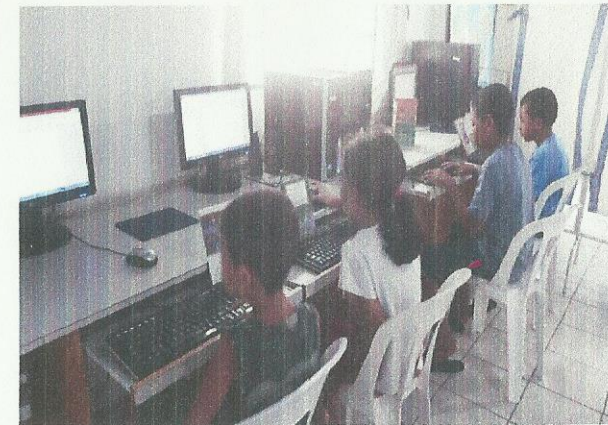
Aula de Informática. Data: 17/03/2020.