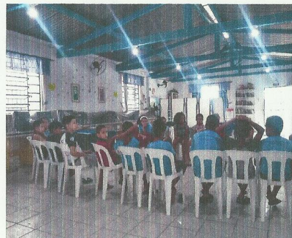
Dia Internacional da Mulher. Data: 04/03/2020