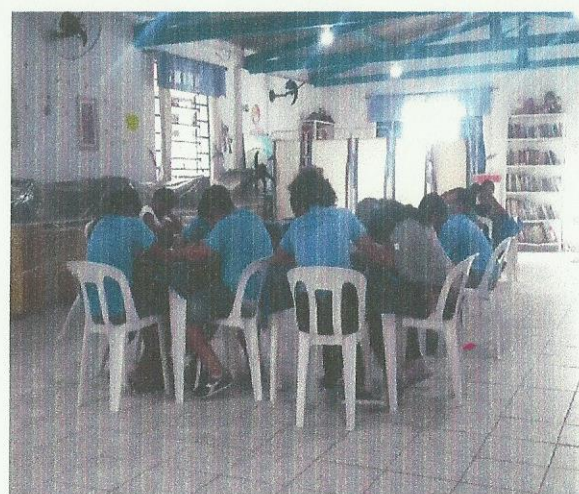
O que me faz bem. Data: 09/03/2020.