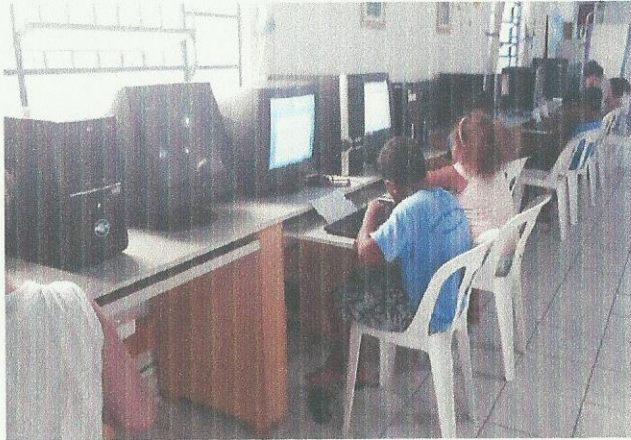
Aula de Informática. Data: 10/03/2020.

RUA ÁLVARES CABRAL, 381 - CAMPO DO GALVÃO - GUARATINGUETÁ- SP CEP 12505-070 - FONE: (12) 3132-7959- CNPJ 48 548 184/0001-55 www.irmaoaltino.com.br - E-mail: gf@irmaoaltino.com.br