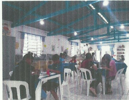
Atividade pedagógica. Data: 11/03/2020.