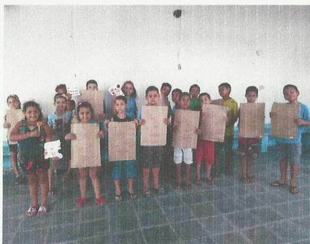
Dia Internacional da Mulher. Data: 06/03/2020.