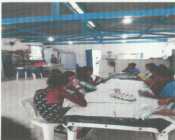
Aula de Artesanato. Data: 05/03/2020.