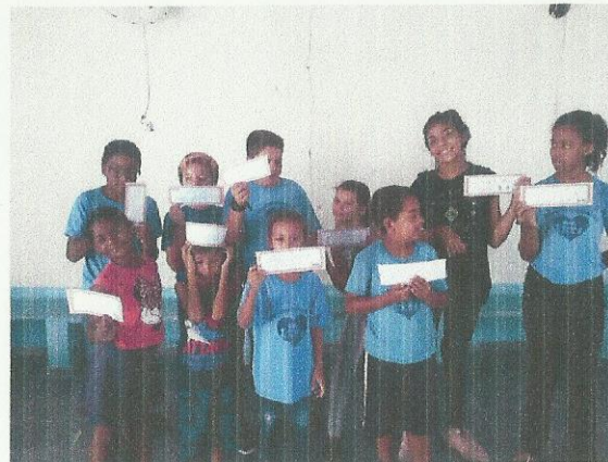
Atividade Pedagógica. Data: 16/03/2020.