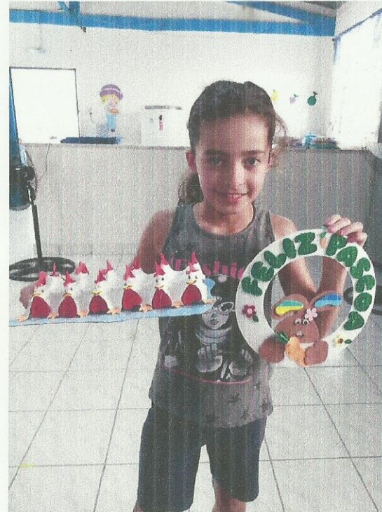
Aula de Artesanato. Data: 19/03/2020.