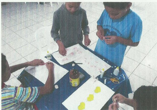
Dia Internacional da Mulher. Data: 02/03/2020.

www.irmaoaltino.com.br - E-mail: gf@irmaoaltino.com.br