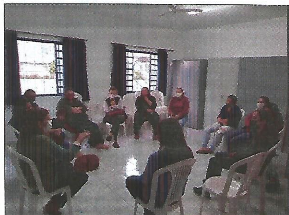
Atividade socioeducativa. Data: 13/09/2022.