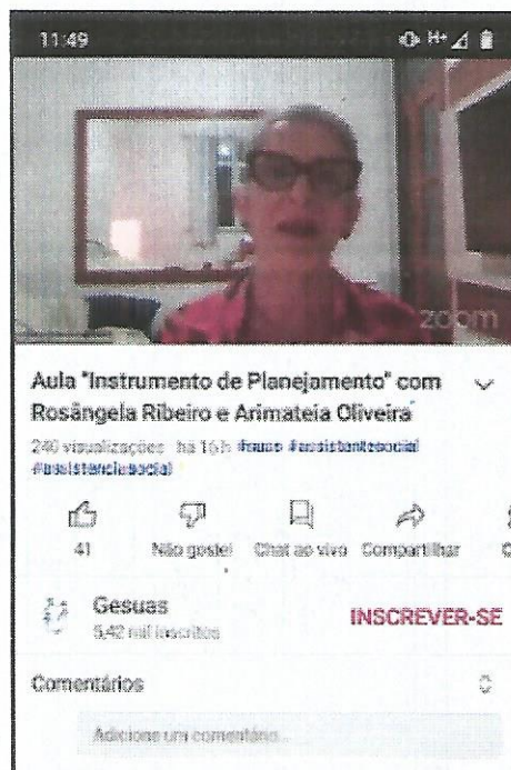
Aula GSUAS. Data: 22/09/2022.