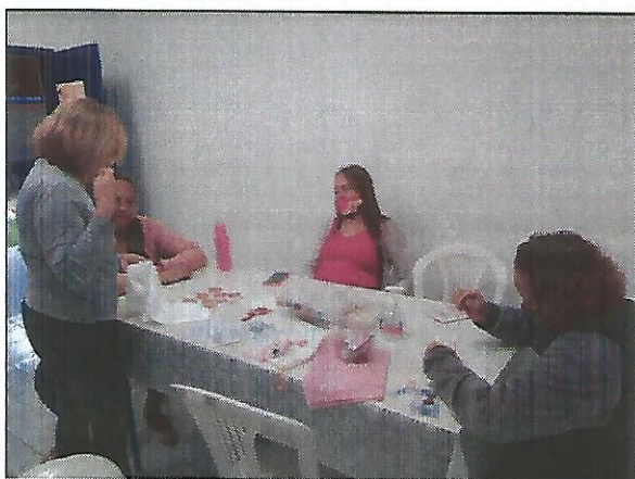
Oficina de bordado. Data: 15/09/2022.