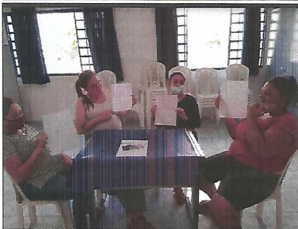
Atividade socioeducativa. Data: 01/09/2022.

FILIADO A OSCAL E USE - UTILIDADE PÚBLICA FEDERAL, ESTADUAL E MUNICIPAL FUNDADO EM 25/06/1960 RUA ALVARES CABRAL, 381 - CEP 12505-070 - CAMPO DO GALVÃO - GUARATINGUETÁ - SP FONE 3132 7959 CNPJ 48.548.184/0001-55 e-mail gf@irmaoaltino.com.br