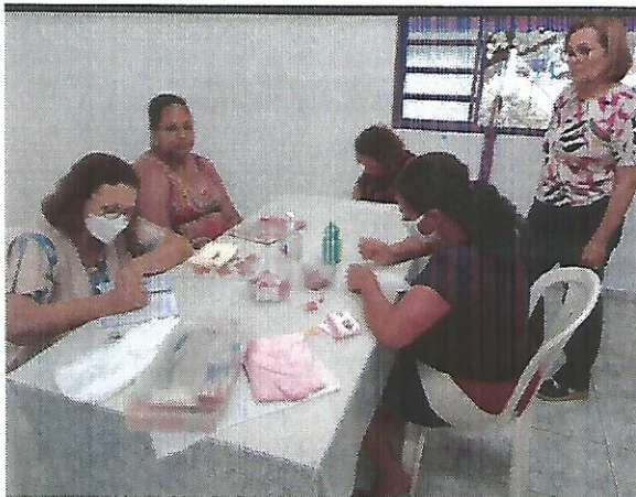
Oficina de bordado. Data: 22/09/2022.