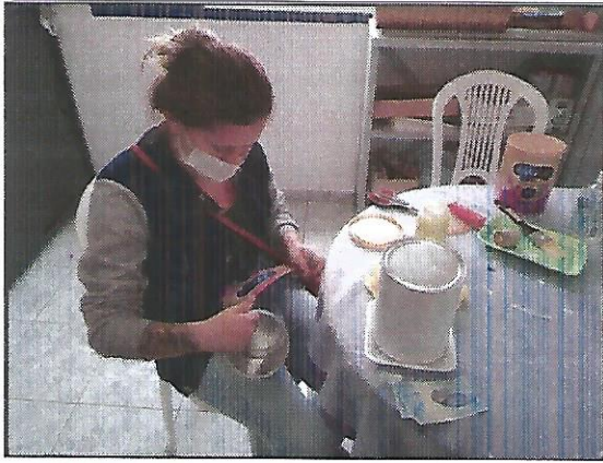
Oficina de pintura. Data: 27/09/2022.

RUA ALVARES CABRAL, 381 - CEP 12505-070 - CAMPO DO GALVÃO - GUARATINGUETÁ - SP FONE 3132 7959CNPJ 48.548.184/0001-55 e-mail gf@irmaoaltino.com.br