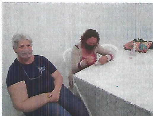
Oficina de bordado. Data: 29/09/2022.