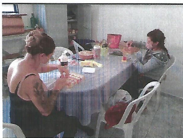
Oficina de pintura. Data: 06/09/2022.