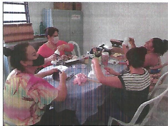
Oficina de pintura. Data: 08/09/2022.