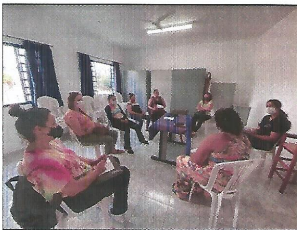
Atividade socioeducativa. Data: 08/09/2022.