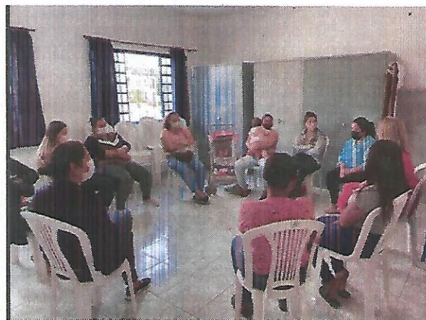
Atividade socioeducativa. Data: 06/09/2022.