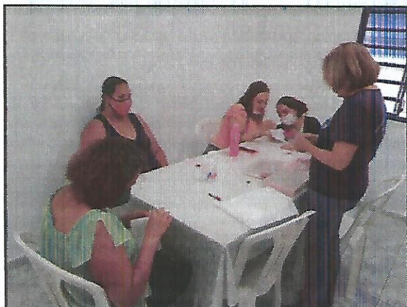
Oficina de bordado. Data: 08/09/2022.