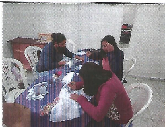
Oficina de bordado. Data: 13/09/2022.