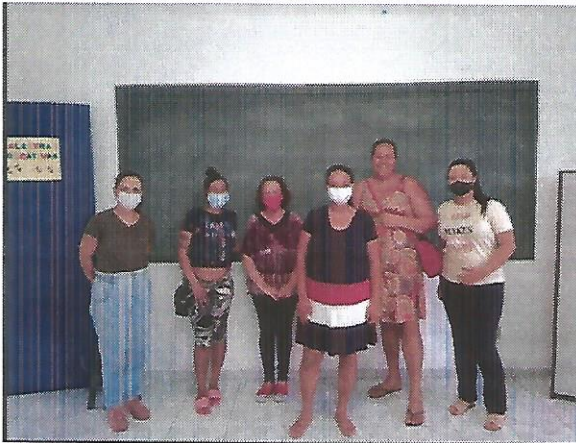
Atividade socioeducativa. Data: 22/09/2022.