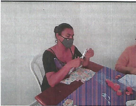
Oficina de fuxico. Data: 27/09/2022.