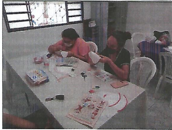
Oficina de bordado. Data: 27/09/2022.