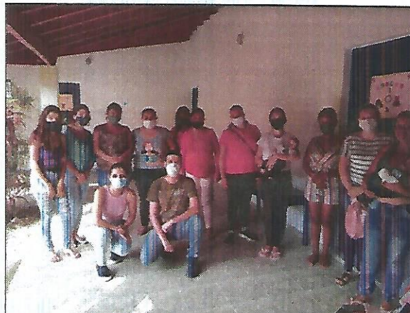
Atividade socioeducativa. Data: 20/09/2022.