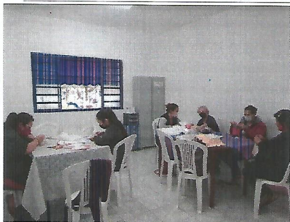
Oficina de bordado e tricô. Data: 13/09/2022.

FONE 3132 7959CNPJ 48.548.184/0001-55 e-mail gf@irmaoaltino.com.br