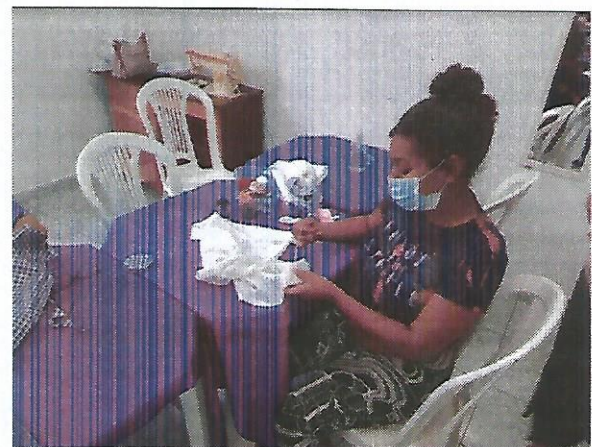
Oficina de bordado. Data: 22/09/2022.

Handwritten signature or initials in blue ink.