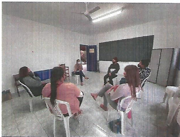
Atividade socioeducativa. Data: 15/09/2022.