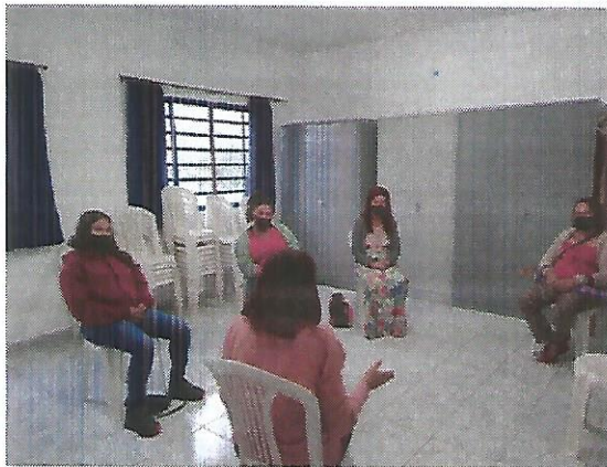
Atividade socioeducativa. Data: 29/09/2022.