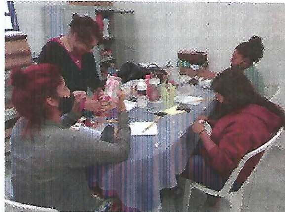
Oficina de pintura. Data: 29/09/2022.