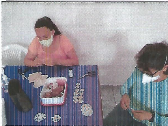
Oficina de fuxico. Data: 06/09/2022.

RUA ALVARES CABRAL, 381 - CEP 12505-070 - CAMPO DO GALVÃO - GUARATINGUETÁ - SP FONE 3132 7959CNPJ 48.548.184/0001-55 e-mail gf@irmaoaltino.com.br