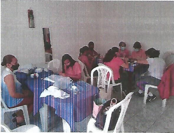
Oficina de bordado e fuxico. Data: 20/09/2022.

RUA ALVARES CABRAL, 381 - CEP 12505-070 - CAMPO DO GALVÃO - GUARATINGUETÁ - SP FONE 3132 7959CNPJ 48.548.184/0001-55 e-mail gf@irmaoaltino.com.br