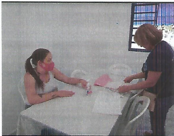
Oficina de bordado. Data: 01/09/2022.