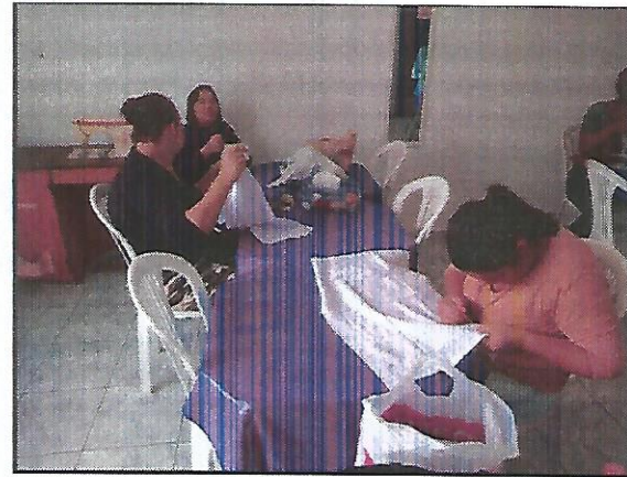
Oficina de bordado. Data: 27/09/2022.