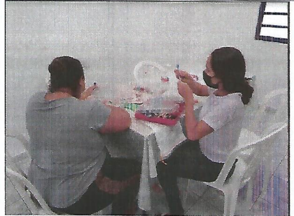
Oficina de bordado. Data: 20/09/2022.