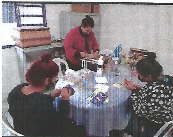
Oficina de pintura. Data: 15/09/2022.