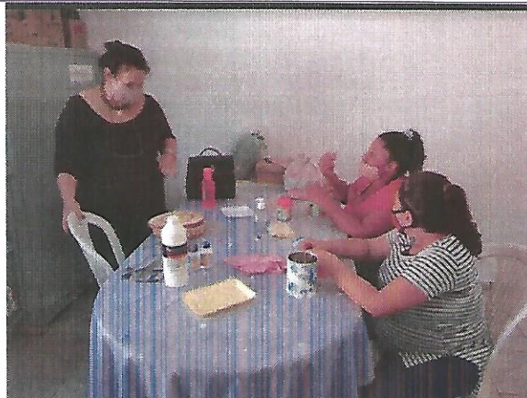
Oficina de pintura. Data: 01/09/2022.