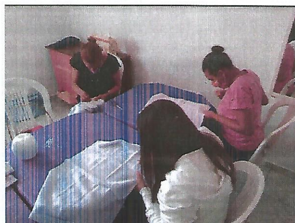
Oficina de bordado. Data: 06/09/2022.