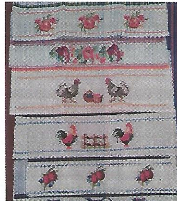
Oficina de bordado. Data: 06/09/2022.