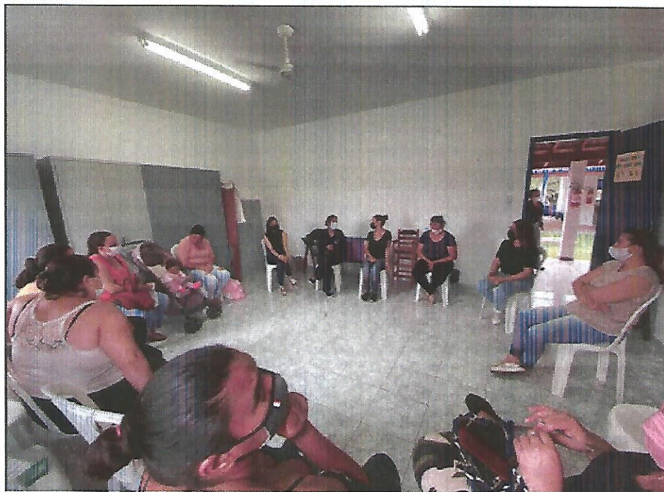
Reunião socioeducativa. Data: 27/09/2022.