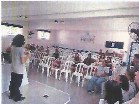
Atividade Socioeducativa HELP. Data: 01/02/2024.