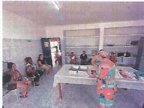
Atividade Socioeducativa Culinária. Data: 06/02/2024.