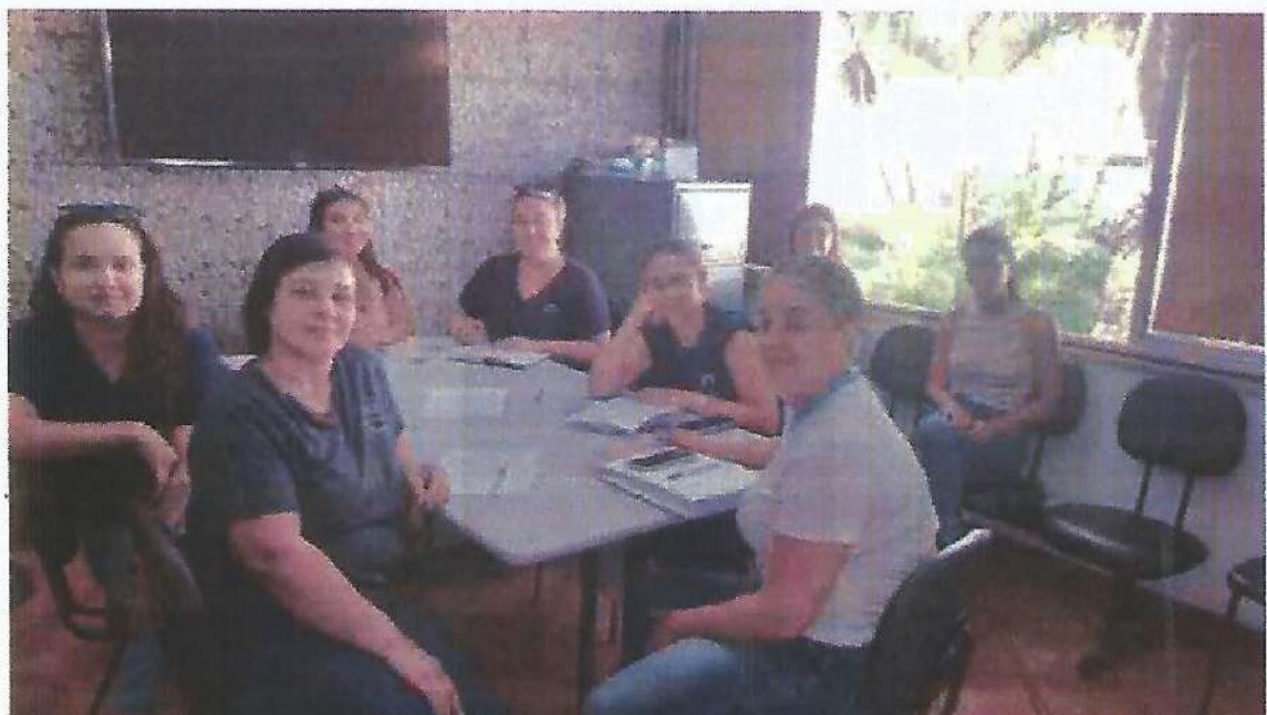
Reunião Ordinária do CMAS. Data: 08/02/2024.