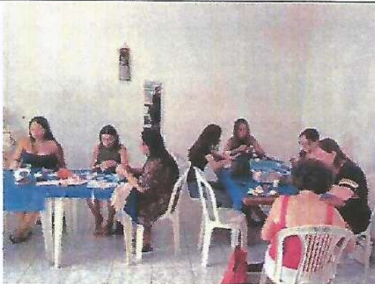
Oficina de fuxico e vagonite. Data: 01/02/2024.