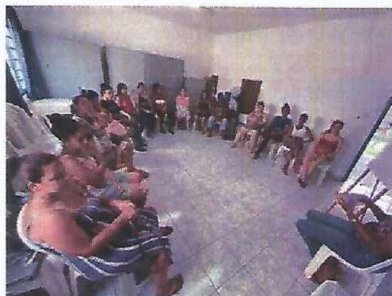
Atividade Socioeducativa Machismo. Data: 29/02/2024.