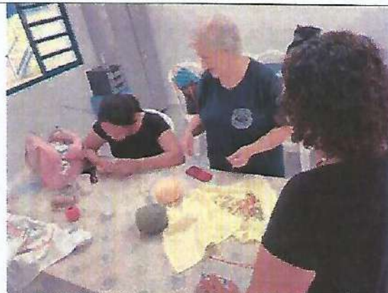
Oficina de bordado. Data: 06/02/2024.