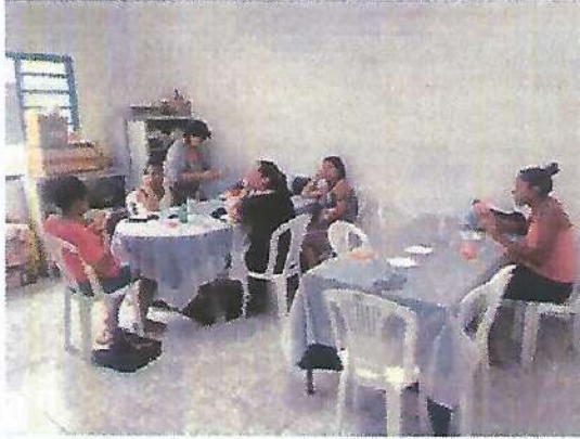
Oficina de pintura. Data: 15/02/2024.

RUA ALVARES CABRAL, 381 - CAMPO DO GALVÃO - GUARATINGUETÁ - SP CEP 12505-070 - FONE 3132 7959 CNPJ 48.548.184/0001-55 www.irmaoaltino.com.br - E-mail gf@irmaoaltino.com.br