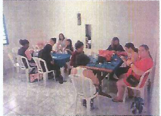
Oficina de fuxico e vagonite. Data: 15/02/2024.