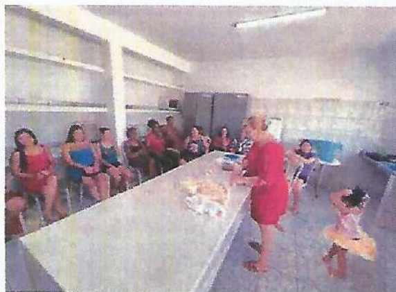
Atividade Socioeducativa Culinária. Data: 08/02/2024.