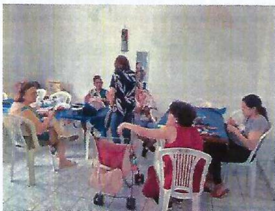
Oficina de fuxico e vagonite. Data: 30/01/2024.