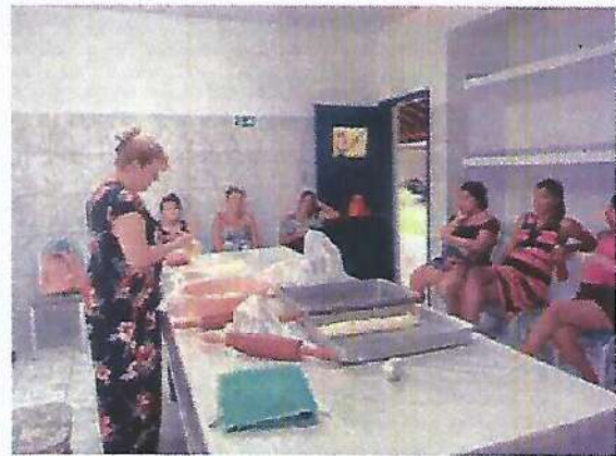
Atividade Socioeducativa. Data: 18/01/2024.