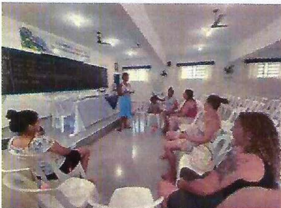
Atividade Socioeducativa. Data: 11/01/2024.