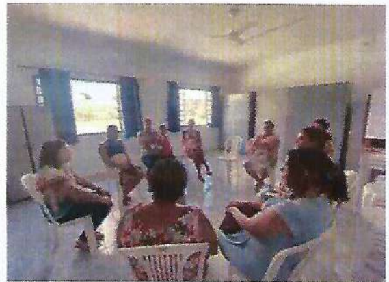
Atividade Socioeducativa. Data: 04/01/2024.