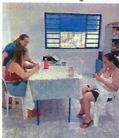
Oficina de bordado. Data: 09/01/2024.