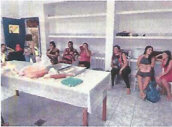
Atividade Socioeducativa. Data: 18/01/2024.

RUA ALVARES CABRAL, 381 - CAMPO DO GALVÃO - GUARATINGUETÁ - SP CEP 12505-070 - FONE 3132 7959 CNPJ 48.548.184/0001-55 www.irmaoaltino.com.br - E-mail gf@irmaoaltino.com.br