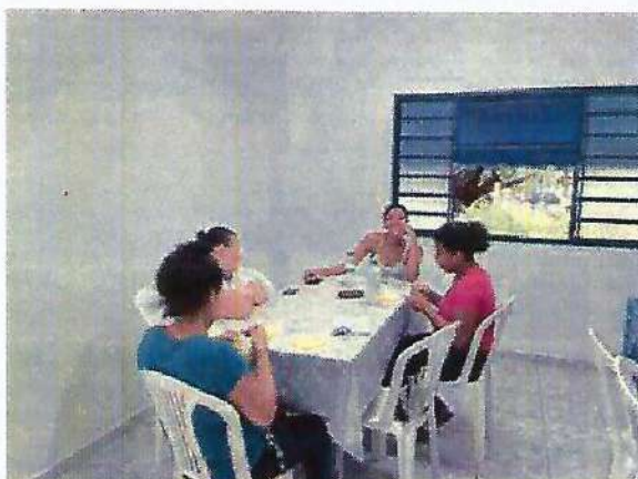
Oficina bordado. Data: 25/01/2024.