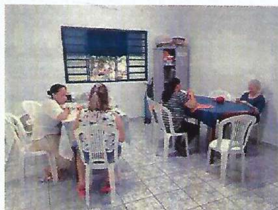
Oficina de bordado. Data: 23/01/2024.