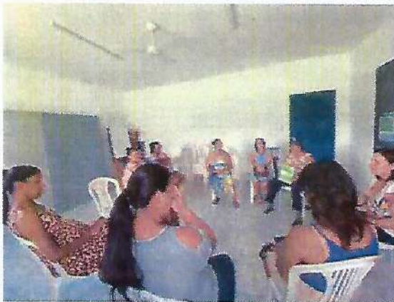
Atividade Socioeducativa. Data: 04/01/2024.