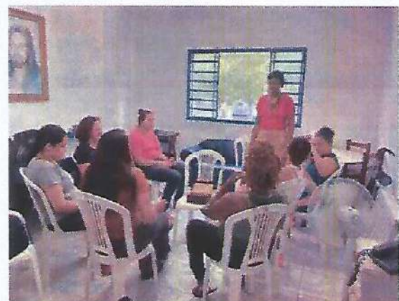
Atividade Socioeducativa. Data: 30/01/2024.