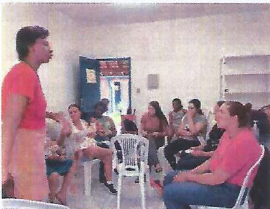
Atividade Socioeducativa. Data: 30/01/2024.