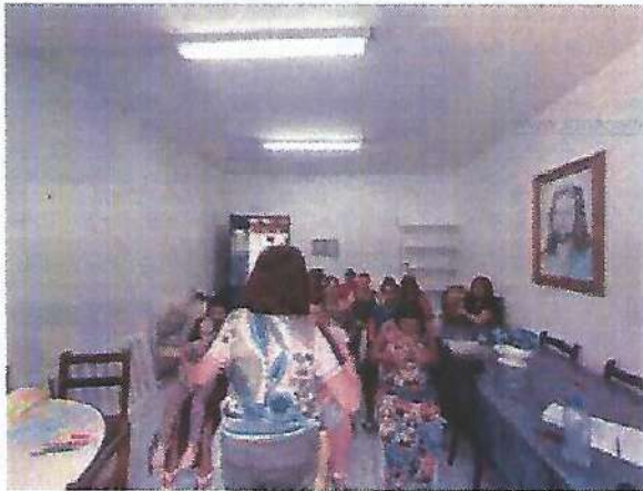
Atividade Socioeducativa. Data: 25/01/2024.