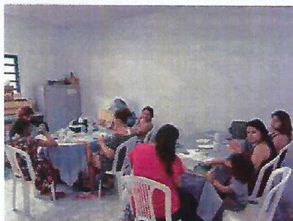
Oficina de pintura. Data: 25/01/2024.