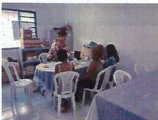
Oficina de pintura. Data: 30/01/2024.