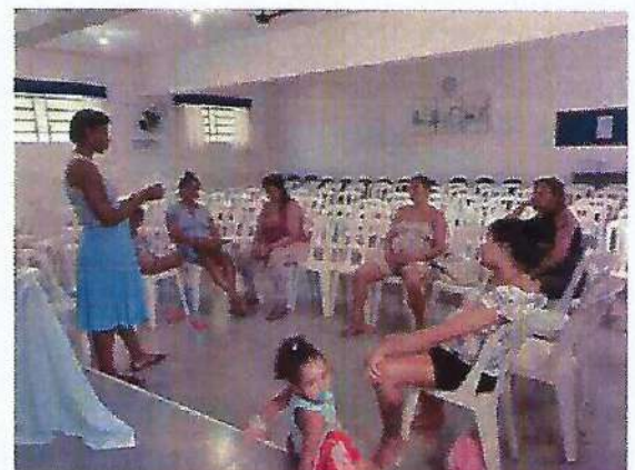
Atividade Socioeducativa. Data: 11/01/2024.