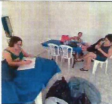
Oficina de fuxico e vagonite. Data: 09/01/2024.