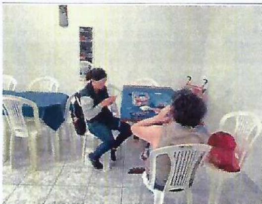
Oficina de fuxico de vagonite Data: 23/01/2024.

RUA ALVARES CABRAL, 381 - CAMPO DO GALVÃO - GUARATINGUETÁ - SP CEP 12505-070 - FONE 3132 7959 CNPJ 48.548.184/0001-55 www.irmaoaltino.com.br - E-mail gf@irmaoaltino.com.br