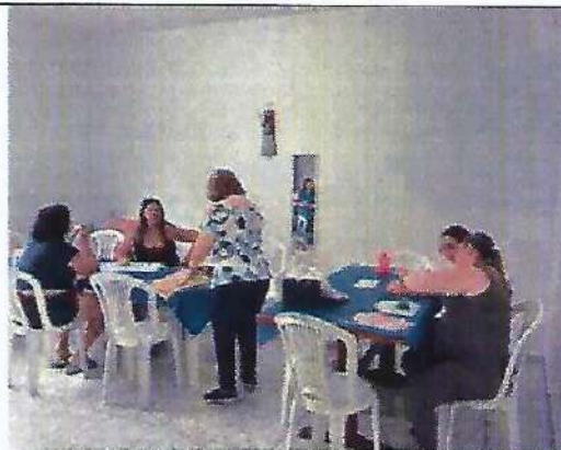
Oficina de fuxico e vagonite. Data: 25/01/2024.