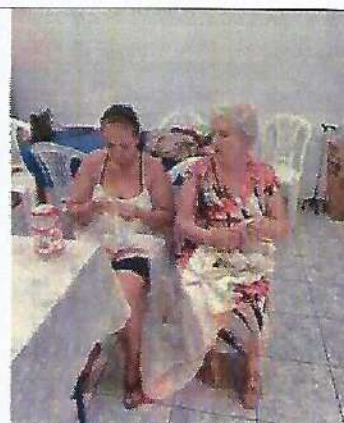
Oficina de bordado. Data: 09/01/2024.