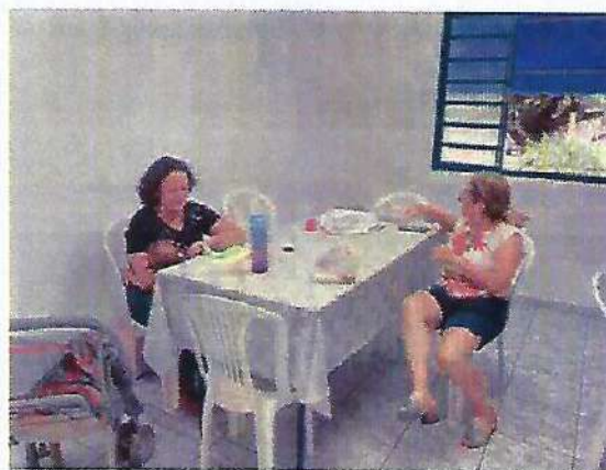
Oficina de bordado. Data: 30/01/2024.