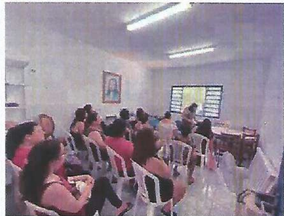
Atividade Socioeducativa. Data: 25/01/2024.