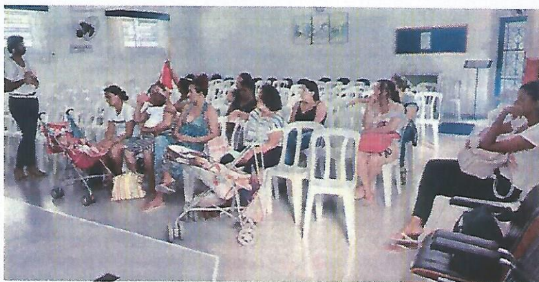
Atividade Socioeducativa CREAS. Data: 11/04/2023. Atividade Socioeducativa CRAS. Data: 16/04/2023.