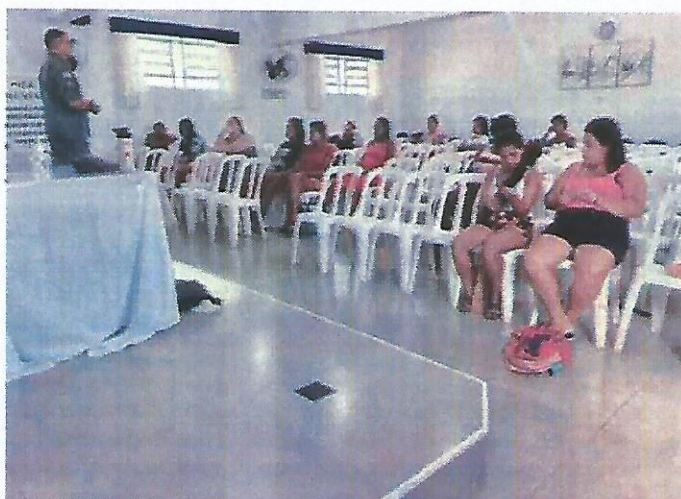
Atividade Socioeducativa Corpo de Bombeiros. Data: 25/04/2024.