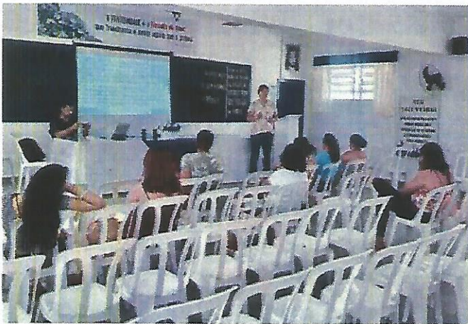
Palestra Socioeducativa CREAS. Data: 09/04/2024.