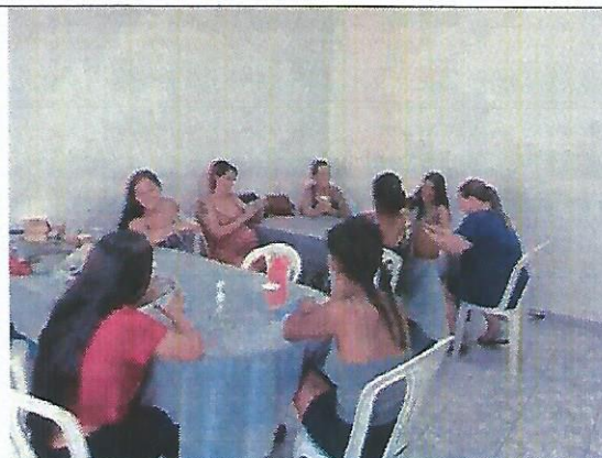
Oficina de pintura. Data: 11/04/2024.