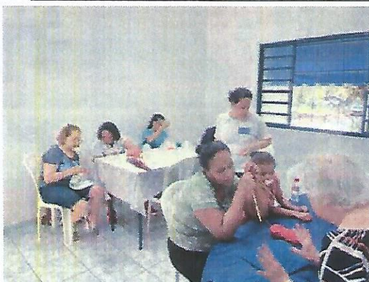
Oficina de bordado. Data: 09/04/2024.

RUA ALVARES CABRAL, 381 - CAMPO DO GALVÃO - GUARATINGUETÁ - SP CEP 12505-070 - FONE 3132 7959 CNPJ 48.548.184/0001-55 www.irmaoaltino.com.br - E-mail gf@irmaoaltino.com.br