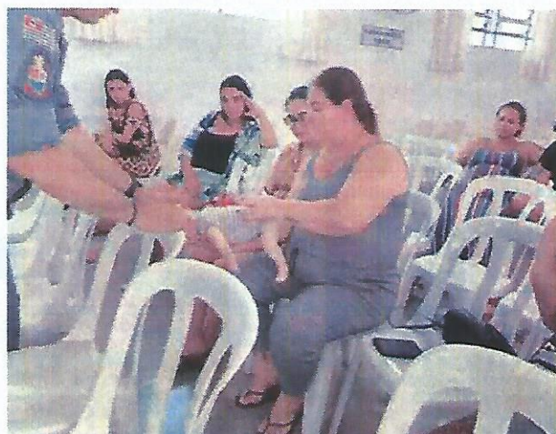
Palestra Socioeducativa Bombeiros. Data: 18/04/2024.