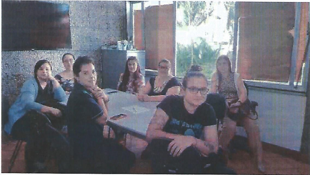
Reunião extraordinária CMAS. Data 22/04/2024.

RUA ALVARES CABRAL, 381 - CAMPO DO GALVÃO - GUARATINGUETÁ - SP CEP 12505-070 - FONE 3132 7959 CNPJ 48.548.184/0001-55 www.irmaoaltino.com.br - E-mail gf@irmaoaltino.com.br