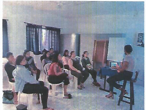
Palestra Socioeducativa CRAS. Data: 18/04/2024.