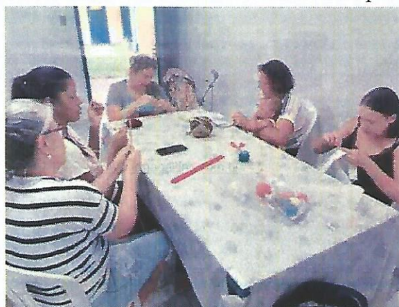
Oficina de bordado. Data: 16/04/2024.

OBJETIVO ESPECÍFICO: Contribuir para a articulação da rede socioassistencial, dos demais órgãos e das demais políticas públicas.