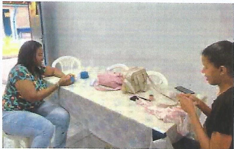
Oficina de Bordado. Data: 29/10/2024.