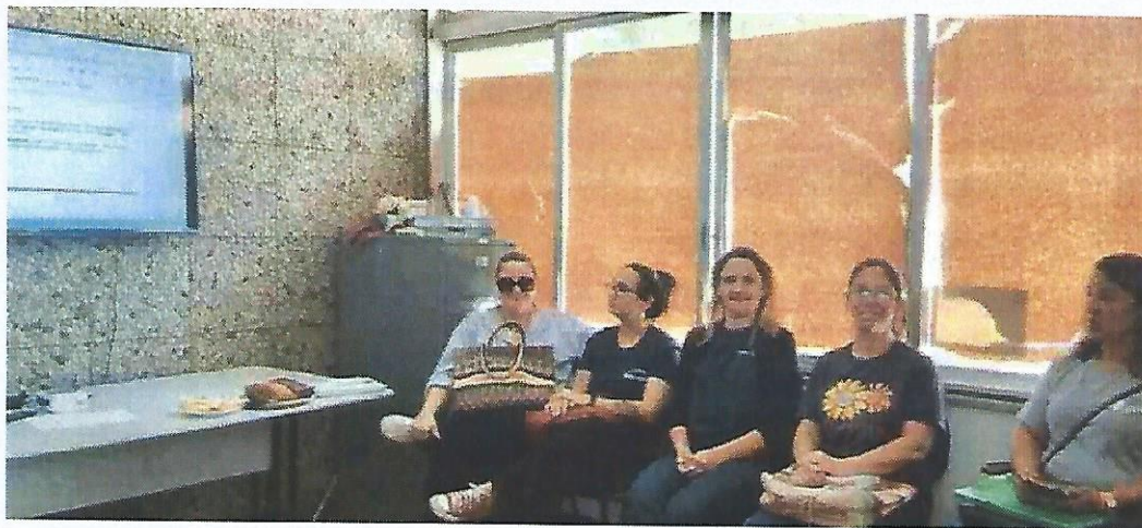
Reunião Gestão de Parcerias. Data: 08/10/2024.

RUA ALVARES CABRAL, 381 - CAMPO DO GALVÃO - GUARATINGUETÁ - SP CEP 12505-070 - FONE 3132 7959 CNPJ 48.548.184/0001-55 www.irmaoaltino.com.br - E-mail gf@irmaoaltino.com.br