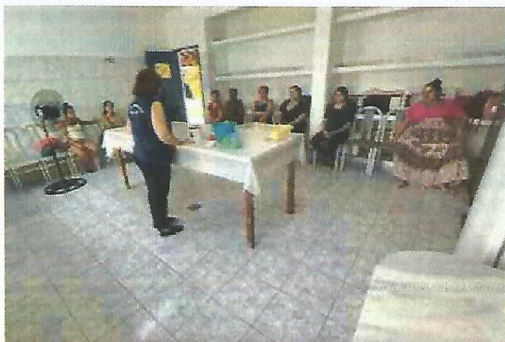
Oficina de culinária. Data: 03/10/2024.

palestra socioeducativa também foi utilizado para repassar alguns avisos e atualizar informações. As oficinas manuais nestes dias aconteceram normalmente.