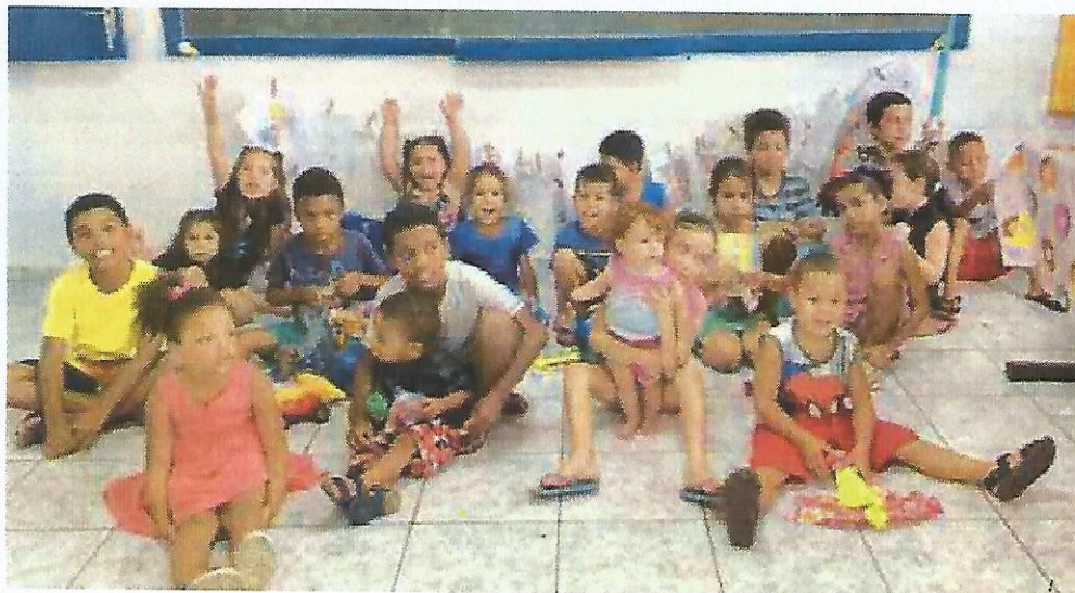
Comemoração Dia das Crianças. Data: 31/10//2024.

RUA ALVARES CABRAL, 381 - CAMPO DO GALVÃO - GUARATINGUETÁ - SP CEP 12505-070 - FONE 3132 7959 CNPJ 48.548.184/0001-55 www.irmaoaltino.com.br - E-mail gf@irmaoaltino.com.br