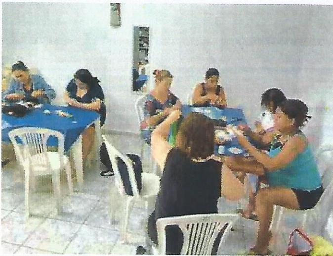
Oficina de fuxico e vagonite. Data: 24/10/2024.