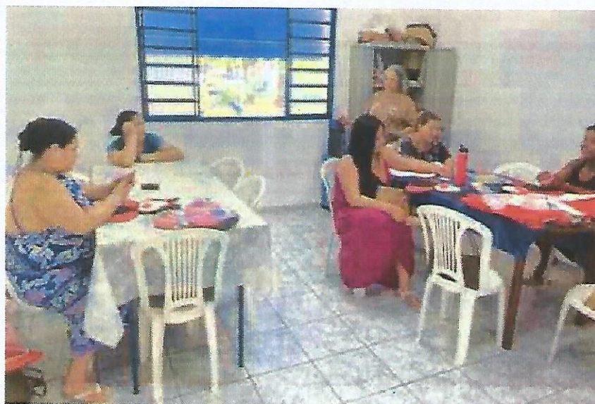
Oficina de E.V.A. Data: 31/10/2024.