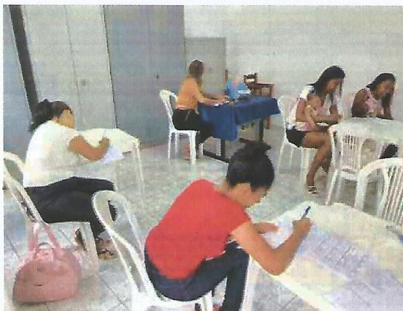
Palestra socioeducativa. Data: 22/10/2024.