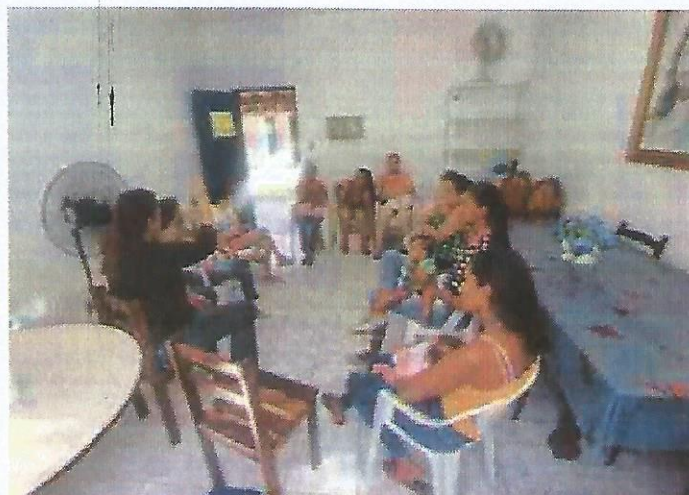
Palestra Socioeducativa. Data: 15/10/2024.