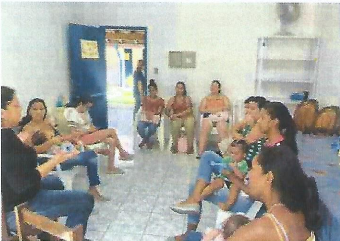
Palestra Secretaria da Saúde. Data: 15/10/2024.