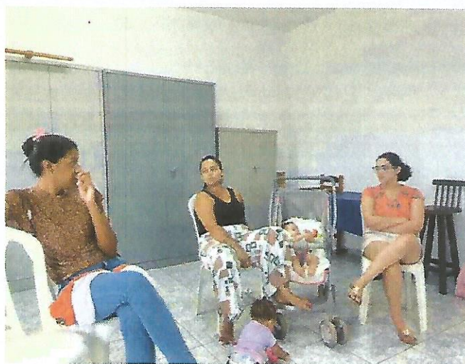
Palestra socioeducativa. Data: 07/01/2025.