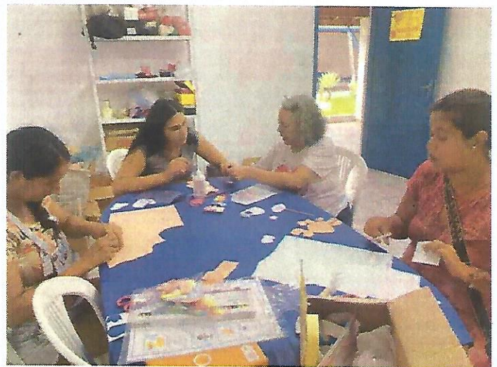
Oficina da E.V.A. Data: 30/01/2025.