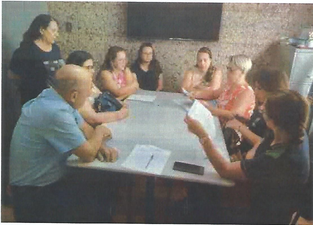
Reunião CMAS. Data: 07/01/2025.