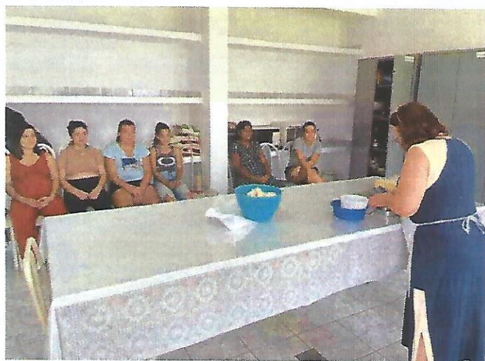
Oficina de culinária. Data: 16/01/2025.