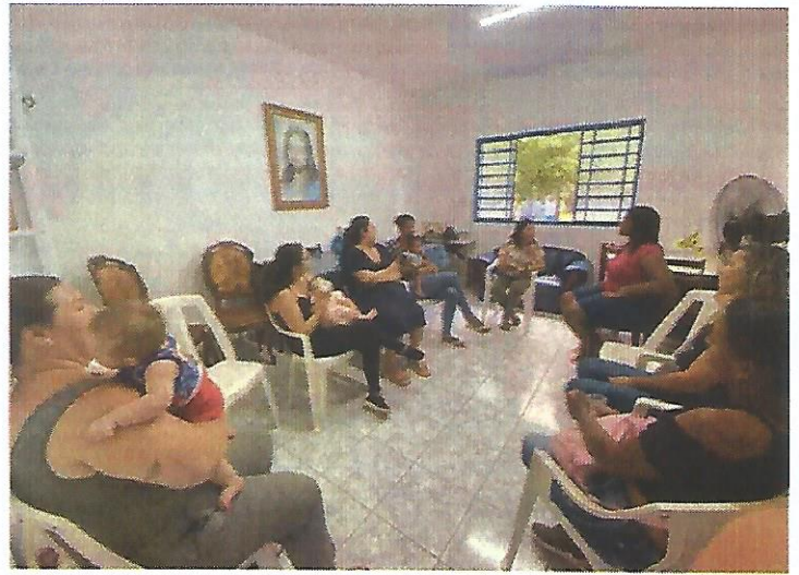
Palestra socioeducativa. Data: 28/01/2025.