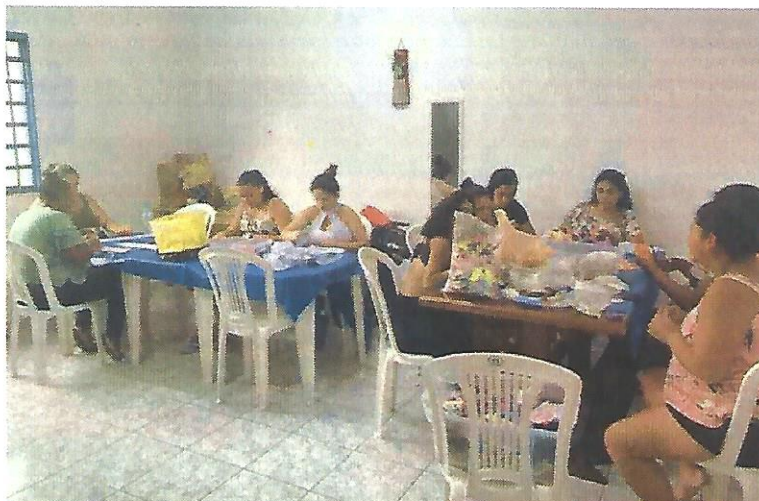
Oficina de fuxico e vagonite. Data: 30/01/2025.

RUA ALVARES CABRAL, 381 - CAMPO DO GALVÃO - GUARATINGUETÁ - SP CEP 12505-070 - FONE 3132 7959 CNPJ 48.548.184/0001-55 www.irmaoaltino.com.br - E-mail gf@irmaoaltino.com.br