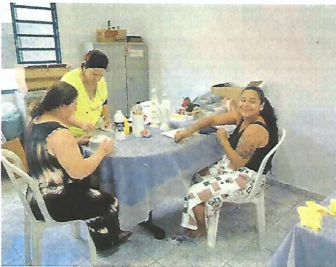
Oficina de pintura. Data: 021/01/2025.

Observações: Por se tratar de um período o qual muitas gestantes novas ingressam no Plano BEM, é comum que aconteça muitas mudanças de oficinas, pois as gestantes ficam nas que se identificam mais. Isto aconteceu em alguns casos, porém neste momento todas já estão participando das oficinais que mais as agradaram.