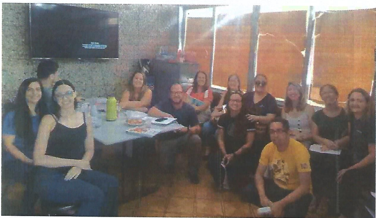
Reunião com gestão de parcerias. Data: 29/01/2025.