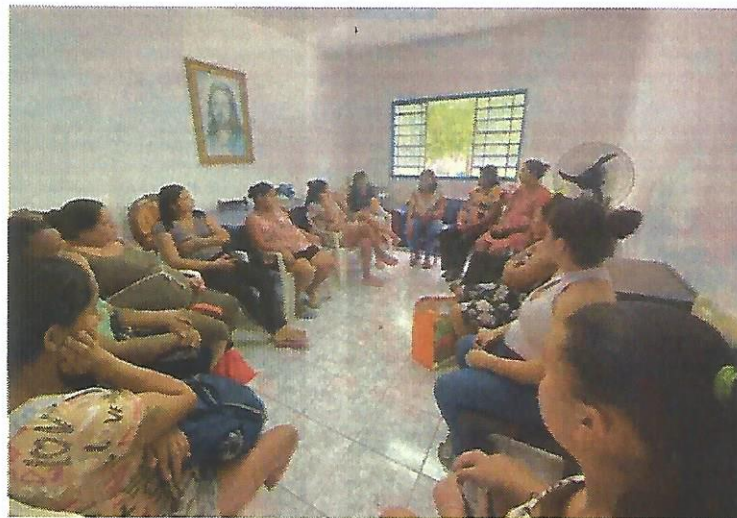
Palestra socioeducativa. Data: 30/01/2025.